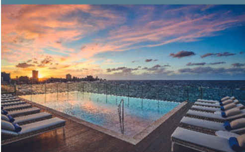
Royalton Cayo Santa María