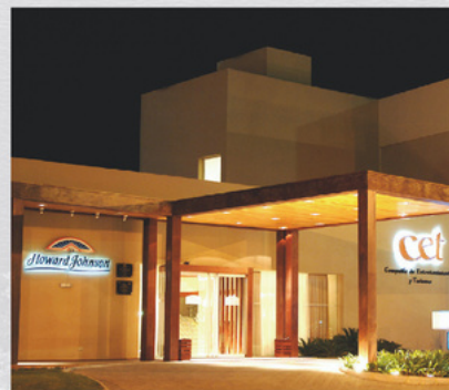
HJ RÍO CUARTO CAPITÁN GIACHINO 551