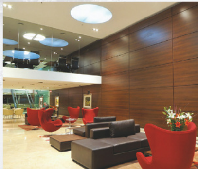
HJ LA CAÑADA FIGUEROA ALCORTA 20