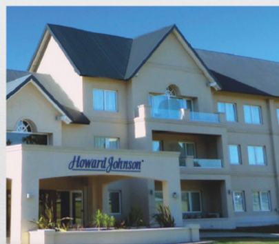
HJ PIEDRAS MORAS RUTA PROV 6, KM 1,7 . ALMAFUERTE