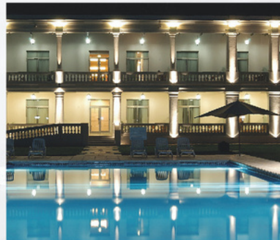
HJ SIERRAS DE ALTA GRACIA AV. VELEZ SARSFIELD 198