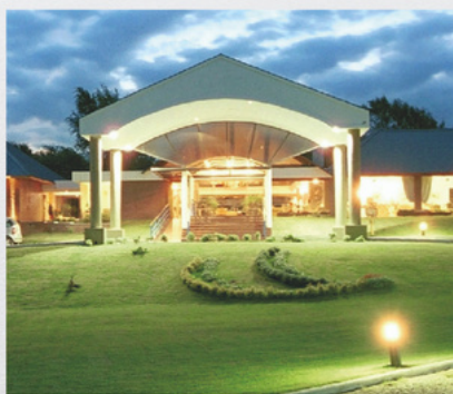
HJ VILLA GRAL BELGRANO TRONADOR S/N, ESQ. ACONQUIJA