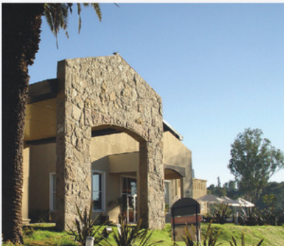
HJ RÍO CEBALLOS SAN MARTÍN 5813