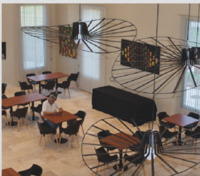
HJ SAN FRANCISCO AV. LA VOZ DE SAN JUSTO 950