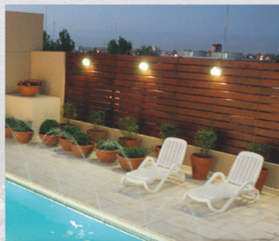
HJ VILLA MARÍA AV. HIPÓLITO IRIGOYEN 329