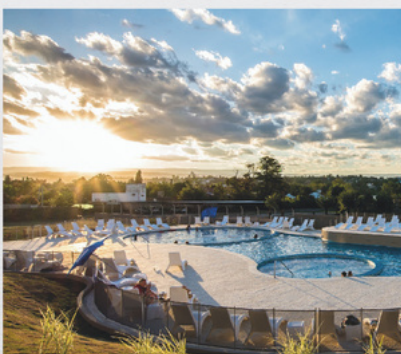
HJ VILLA CARLOS PAZ AZOPARDO ESQUINA ARTIGAS